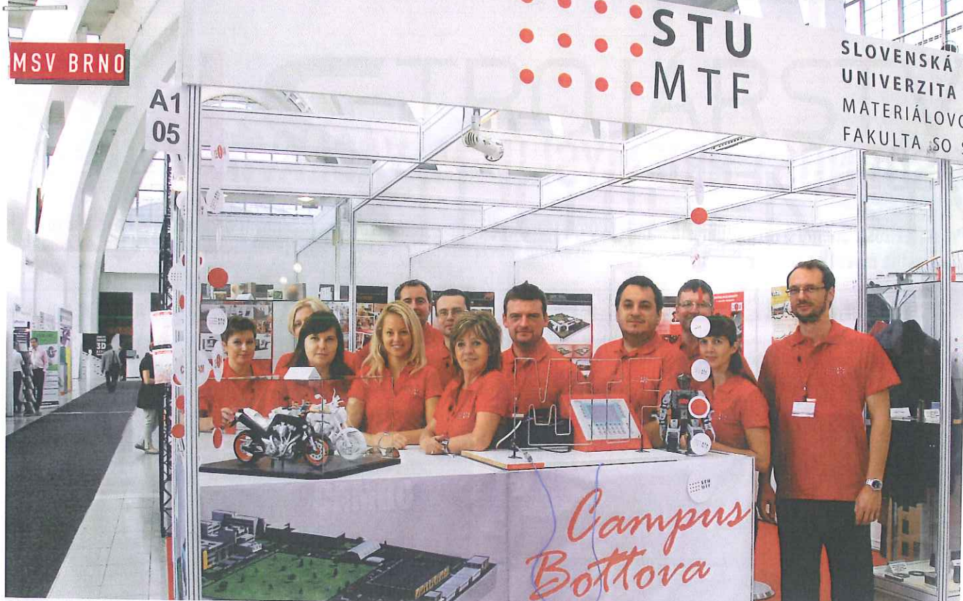
Študenti a pedagógovia MTF na stánku v Brne