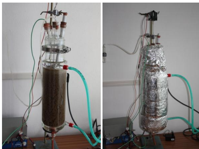
Sklenený laboratórny bioreaktor pre výrobu bioplynu