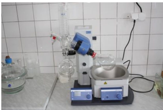
Rotačná vákuová odparka IKA