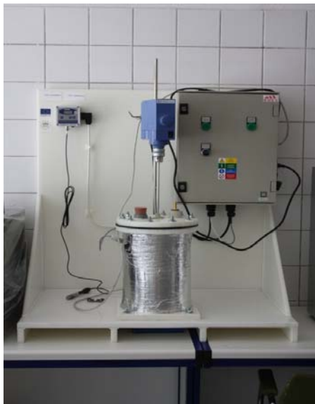
Laboratórna zostava pre výrobu bioetanolu