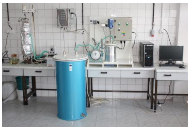
Laboratórna zostava pre výrobu bioplynu