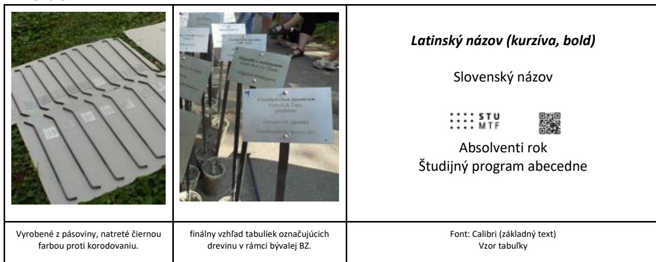
Obrázok 2: Tabuľky použité v Bývalej botanickej záhrade. K umiestneniu nápisu sa použil nerezový plech s rozmermi cca 7x11cm.