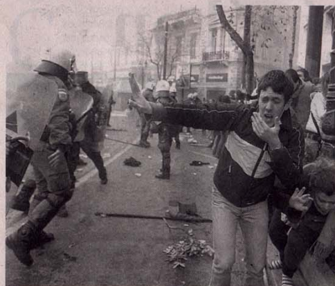
TAKTO VČERA protestovali proti školskej reforme v Grécku.